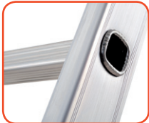
Piolo 27x27 mm, a sezione quadrata 27x27 mm rung, squared