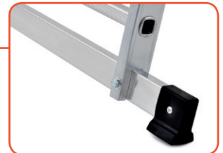
Barra stabilizzatrice con piedini antiscivolo Non-slip stabilizer bar