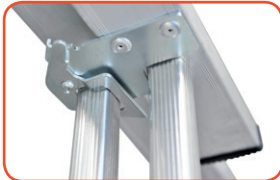
Gancio in alluminio, completo di dispositivo antiscivolo Aluminium hook as non-slipping device