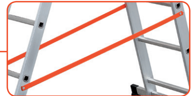
Corda di sicurezza antiapertura Anti-opening rope