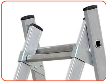
Articolazione in acciaio elettrosaldato rinforzato Electrowelded reinforced steel hinge