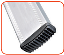
Piedini antiscivolo, massima aderenza al terreno Non-slip feet, high grip